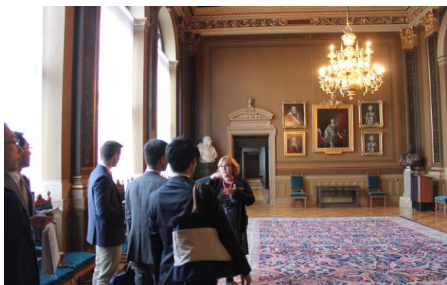
キャンパスツアー