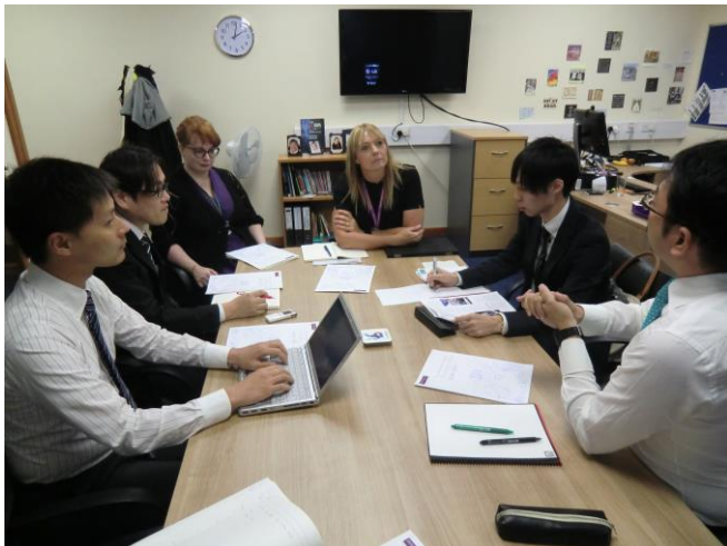
インタビュー風景（２）