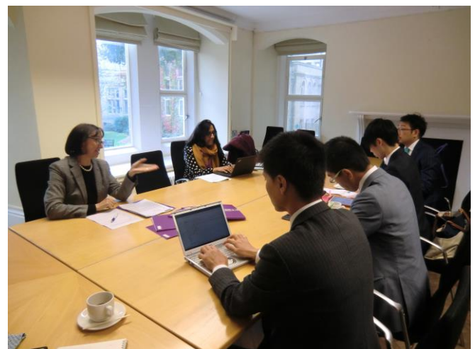
インタビュー風景（1）