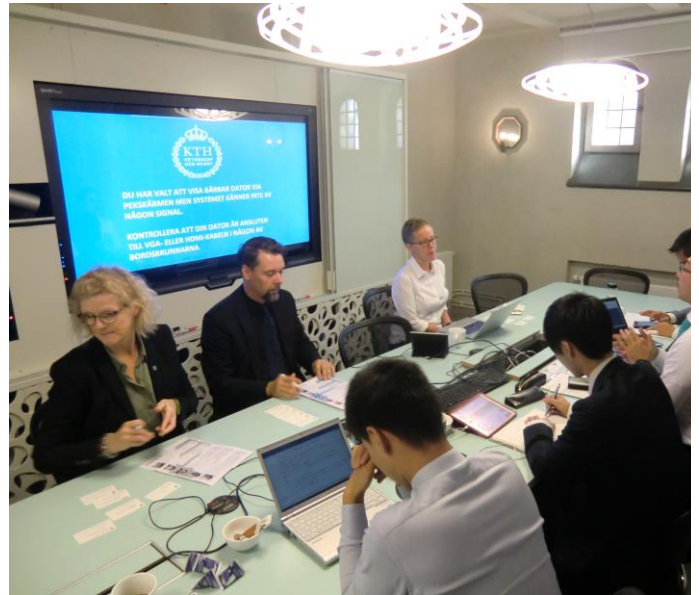
インタビュー風景