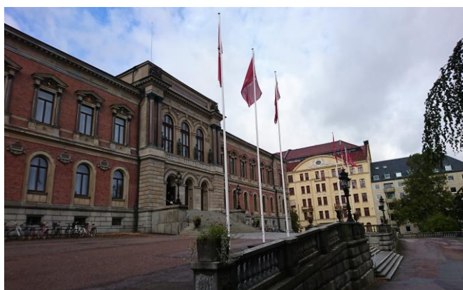
ウプサラ大学本部