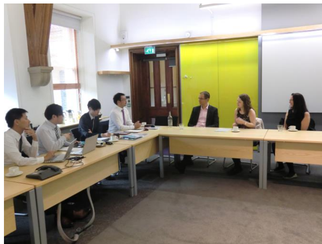
インタビュー風景