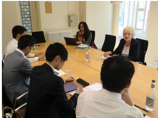
インタビュー風景（３）