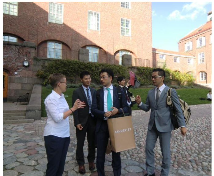
キャンパスツアー