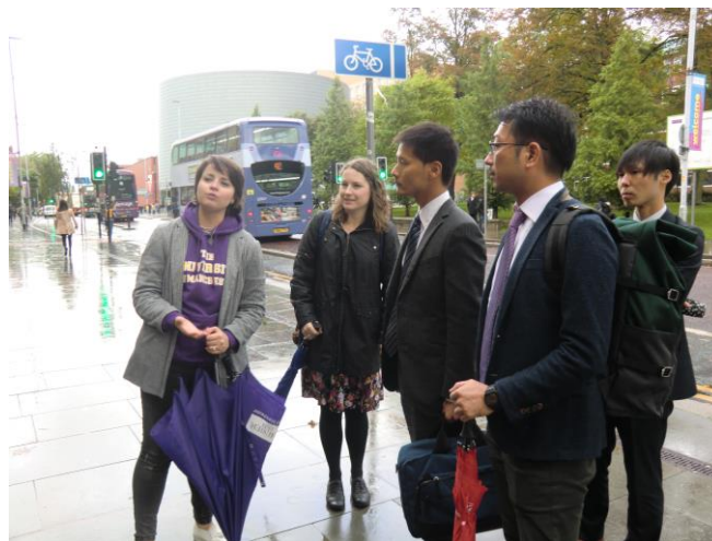
キャンパスツアー