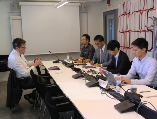
インタビュー風景