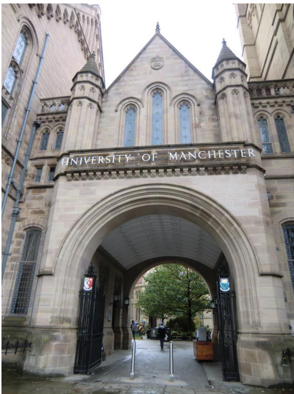
マンチェスター大学 正門